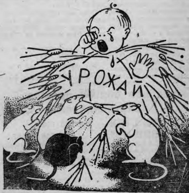
В Кузьминском ТСОЗ'е уборкой урожая занимаются полевые вредители.